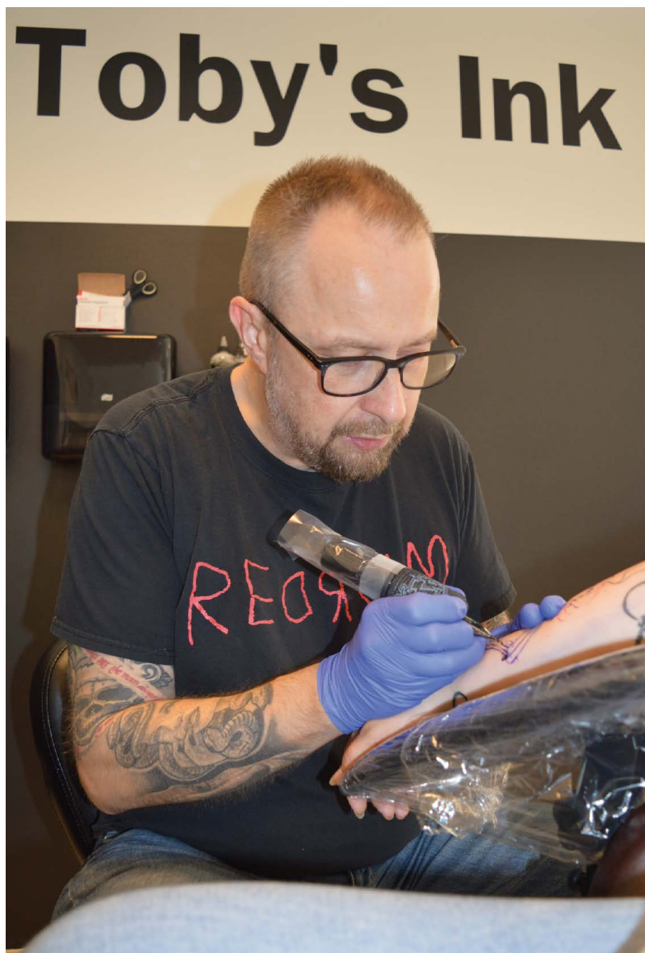
Coronakrisen har generelt været hård ved saloner og klinikker, hvor personalet har tæt kontakt til kunderne. Tatovørforretningen Toby's Ink er ingen undtagelse.